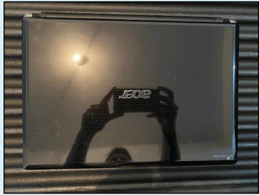
TML - 006