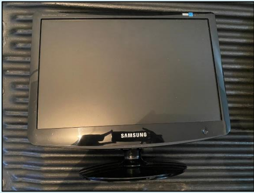
TML - 005