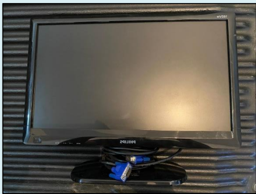
TML - 003