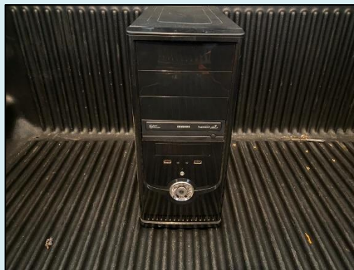
TML - 002