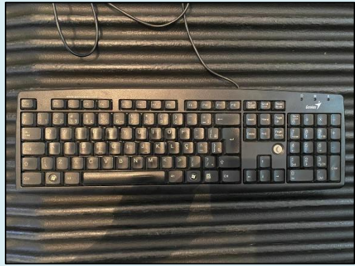
TML - 008