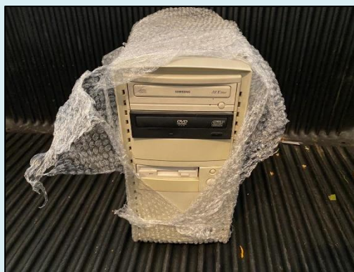
TML - 002