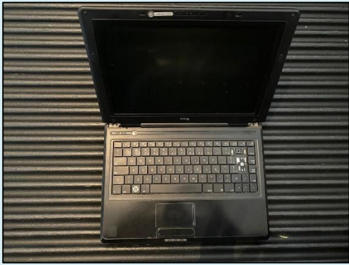
TML - 007