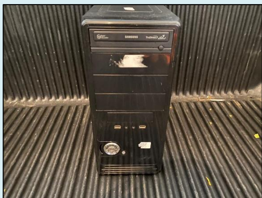
TML - 002