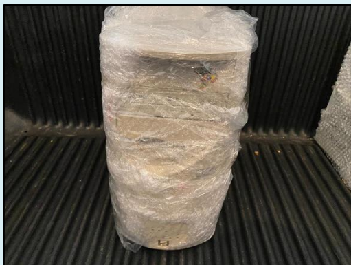
TML - 001