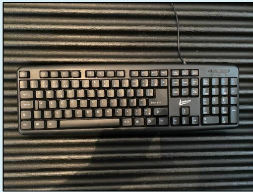
TML - 009