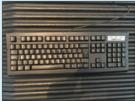
TML - 010