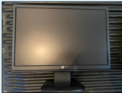
TML - 004