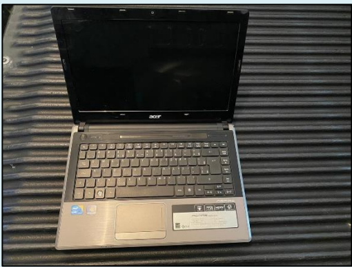
TML - 006