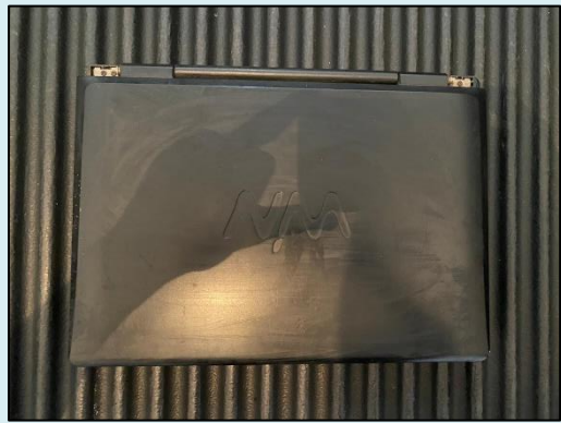
TML - 007