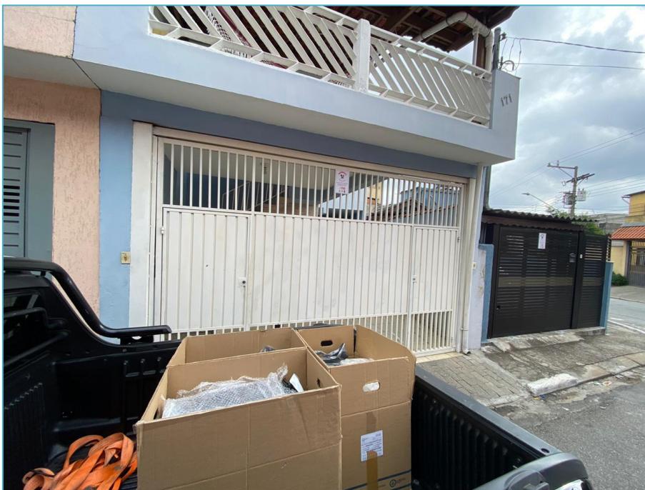
Fachada da residência da retirada.